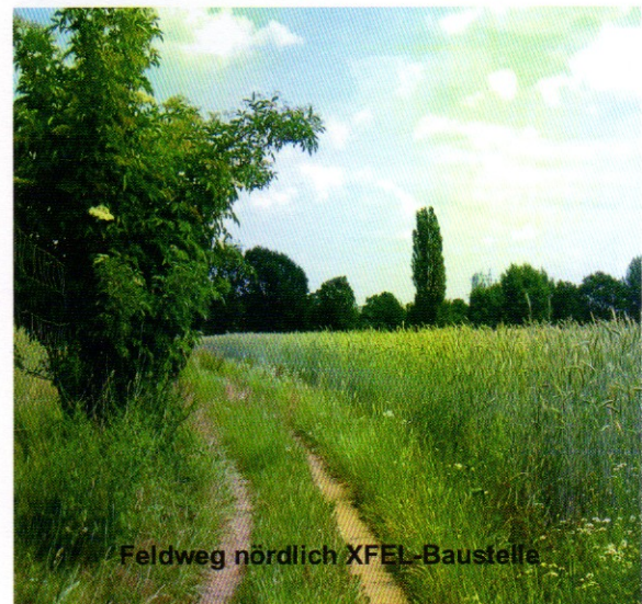
Feldweg nördlich XFEL-Baustelle

Wollen das auch Schenefelds Bürgerinnen und Bürger?